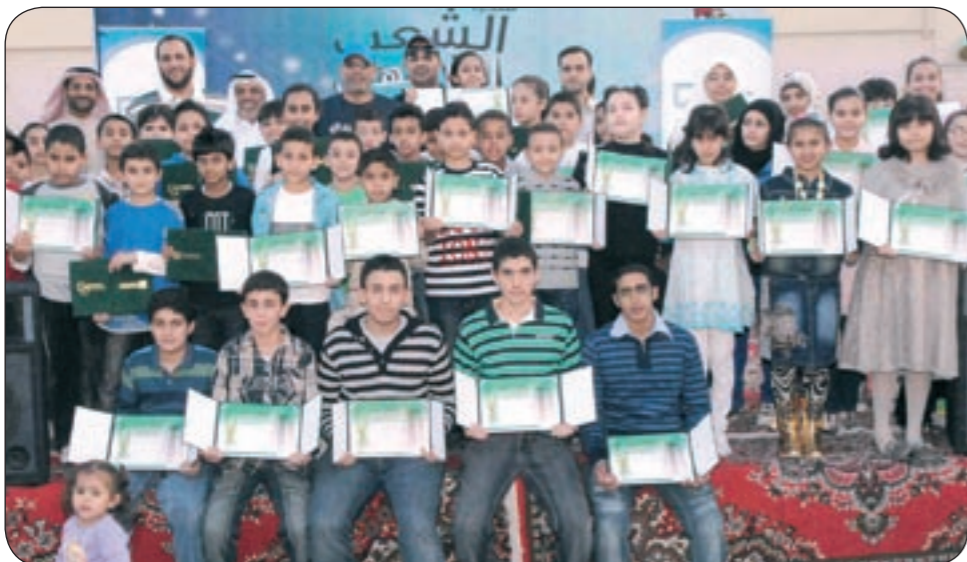
لقطة جماعية للمكرمين

حيث نفتخر في «بيتك» بكل نجاح وتميز ونعنتبره مصدر سعادة وتقدير، داعيا الجميع إلى بذل الجهود والمخاطبة في تحصيل العلم الذي يعد أساس حضارة الشعوب وتطور المجتمعات كما يساهم في بناء الشخصية الصالحة القادرة على خدمة مجتمعها وتطوير ذاتها، ومتمنيا استمرار التفوق والنجاح للجميع وان نرى العام المقبل وجوها جديدة يتم تكريمها والاحتفاء بها. وجرى خلال الحفل الذي تميز بأجواء طيبة واستمتع فيه الحضور بمرافق والعباء متنزّه الشعب المناسبة للجميع، توزيع الجوائز وشهادات التقدير والهدايا على الطلبة المتفوقين، كما شارك الموظفون في برنامج للمسابقات وسحوبات وحصلوا على جوائز وهدايا قيمة.