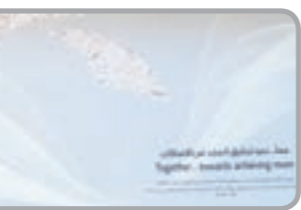
شعار البنك وتبدي توقعات الموظفين

وجاءت فكرة اللوحة بمبادرة من ادارة الاتصالات والعلاقات المؤسسية باعتبارها من الأفكار التي ترسخ علاقة الموظفين بالبنك وتخلق نوعا من العلاقة الخاصة بين الطرفين في ظل التطورات الحالية التي يشهدها البنك.