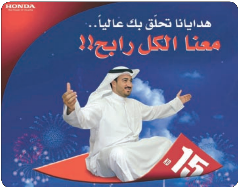
بوستر الحملة التسويقية

حيث أعلن الحمد أسماء الفائزين بجوائز المهرجان بمشاركة الأطفال الذين قاموا باختيار الكوبونات الفائزة من الكوبونات الموضوعة في الصندوق، كما فاز عدد من الأشخاص بأكثر من جائزة إذ أن كل كوبون منها عن كل 15 دينارا من مشتريات ومدفوعات العملاء من اي من فروع الشركة سواء من السيارات الجديدة أو السيارات المستعملة أو القوارب أو الدراجات النارية أو مولدات الطاقة أو قطع الغيار أو مراكز الخدمة، حيث تقسم قيمة الفاتورة على 15 ليحصل العميل على الكوبونات الموافقة لقيمة مصروفاته.