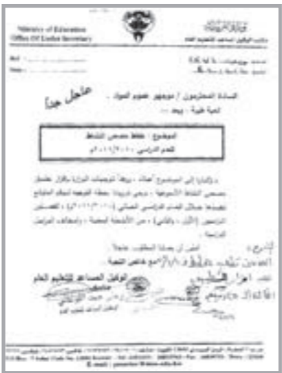
صورة صوتية لكتاب اللوغاني

أهداف الزيارة التي رافق الوفد خلالها سفيرنا في طهران مجدي الظفيري، والتي توجت بلقاء مع محافظ إقليم خراسان د.محمود صلاحي، كانت عديدة وكثيرة، أبرزها تعزيز العلاقات الكويتية - الإيرانية خصوصا والخليجية - الإيرانية عموما، إضافة إلى نقل الشكر إلى القيادة الإيرانية بعد الفتوى التي أصدرها المرشد السيد علي الخامنئي بعدم جواز التعرض للسيدة عائشة رضي الله عنها وأمهاث المؤمنين ورموز الإسلام، وقد أوضح محافظ طهران أن موقف السيد الخامنئي هو تجسيد لحرصه على لئلا شمل المسلمين والتصدي لمن يسعون لزرع الفتنة بينهم. وتشرف الوفد بزيارة مقام الإمام الرضا (عليه السلام) ثامن الأئمة الشيعة، والذي يعد من أجمل التحف المعمارية في العالم. وعلى هامش الزيارة، أكد السفير الظفيري أن زيارة صاحب السمو الأمير الشيخ صباح الأحمد إلى إيران قائمة وأن الكويت تبذل ما بوسعها