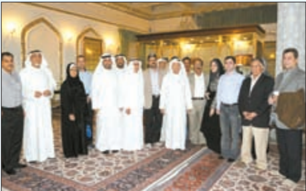
جانب من أعضاء الوفد داخل معرض الروضة الرضوية في مشهد

في المجال العقاري. من ناحيته، أشار النائب د.يوسف الزلزلة إلى أن العلاقات الكويتية - الإيرانية قد شابته بعض الأمور لكنها ستبقى رائدة فسي كثير من المجالات وتطلع إلى تعزيزها، لاسيما اقتصاديا، مضيفا: لقد أكد لنا حسن الضيافة الذي لمسناه ما يقال عن أهل مشهد من أنهم أهلكرم.