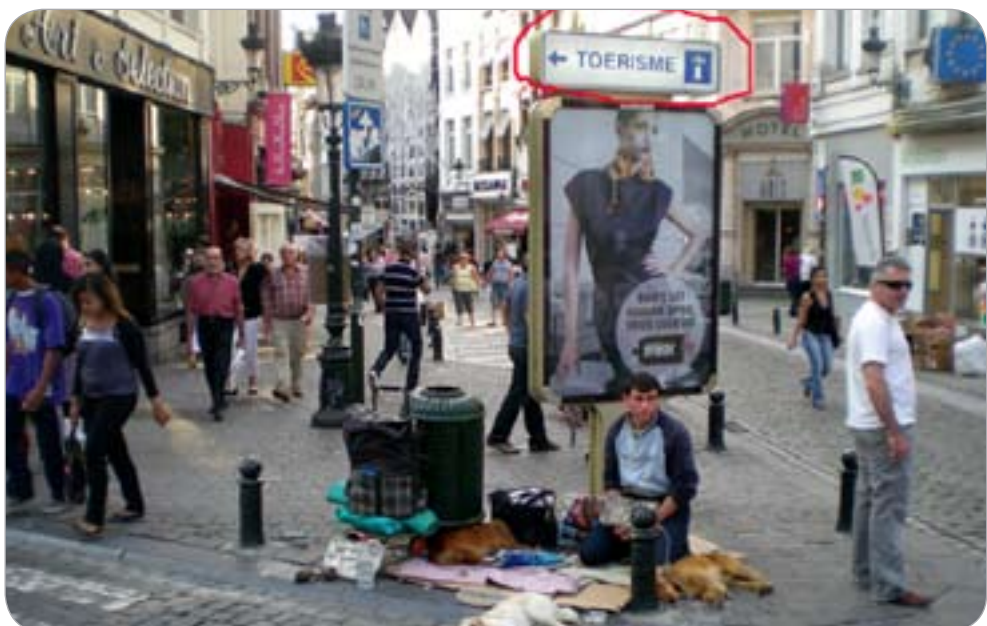
«التسول» ينتشر في شوارع أوروبا

المواد الغذائية لأفقر شعوب الاتحاد الأوروبي. وقال مفوض الاتحاد الأوروبي للتنمية الزراعية داشيان كولوس أن هذه المساعدات مؤشر آخر على أن سياسة الزراعة المشتركة ليست للمزارعين فقط بل لجميع مواطني الاتحاد الأوروبي إذ استفاد في العام الماضي نحو 13 مليون شخص من برامج وطنية مختلفة.