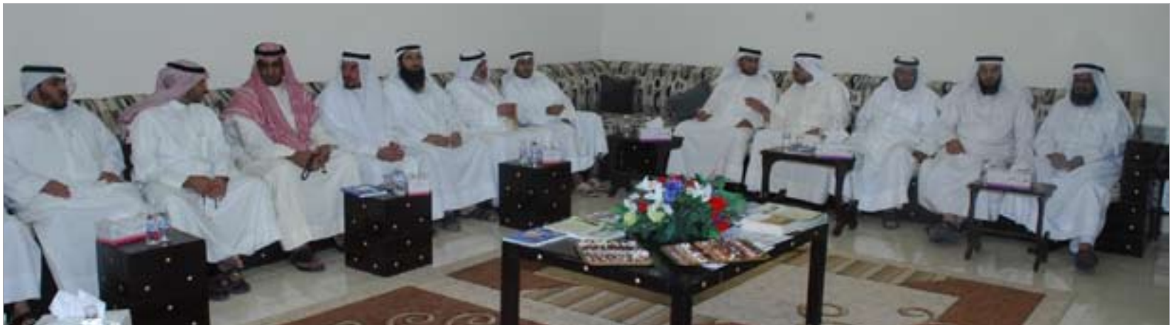
جانب من الحضور في حفل استقبال جمعية الإصلاح بمناسبة عيد الفطر