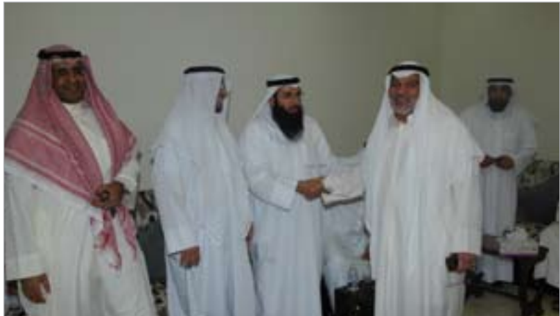
قادة الإصلاح يستقبلون المهنيين