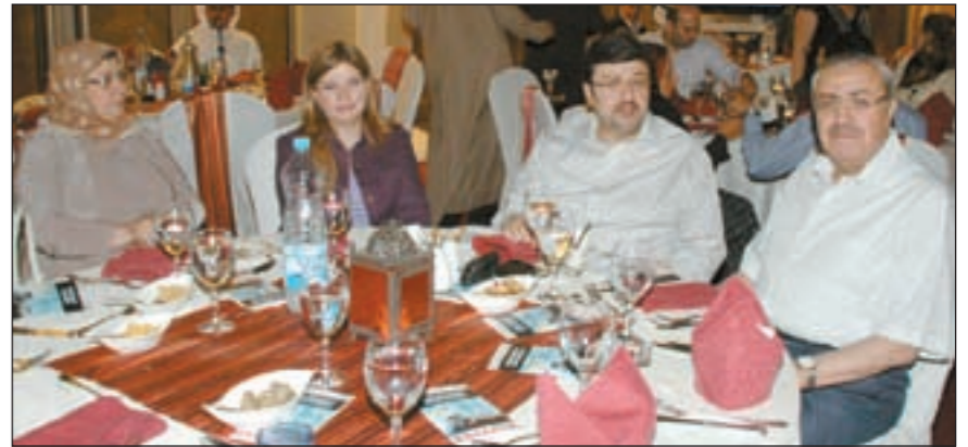
متابعة للغبرات الغبقة