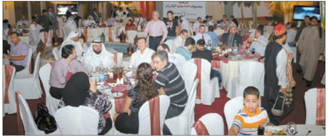
غبقة «ايسوزو».. أوقات طيبة وأجواء رمضان