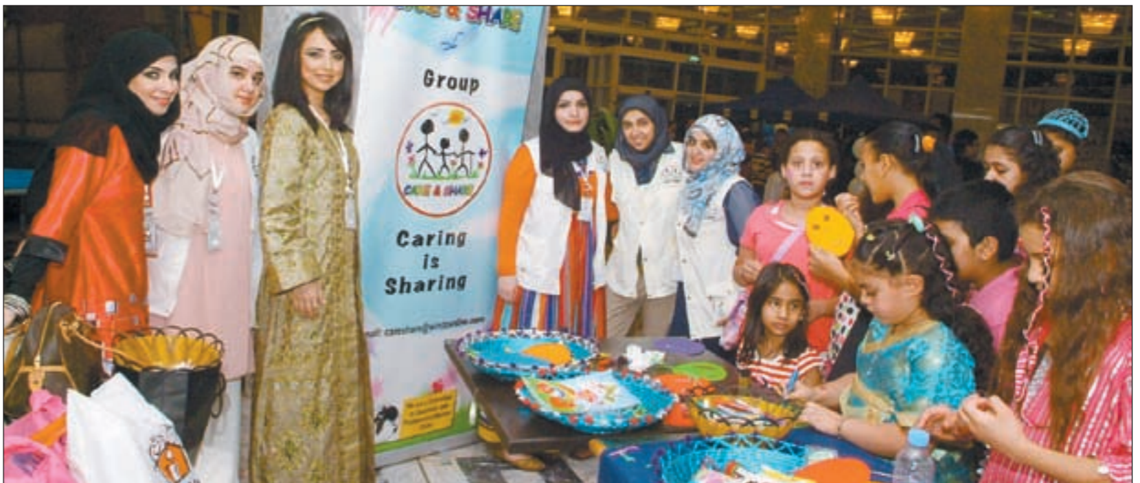
ملابس تراثية ومسابقات في قرقيعان «الكويتية»