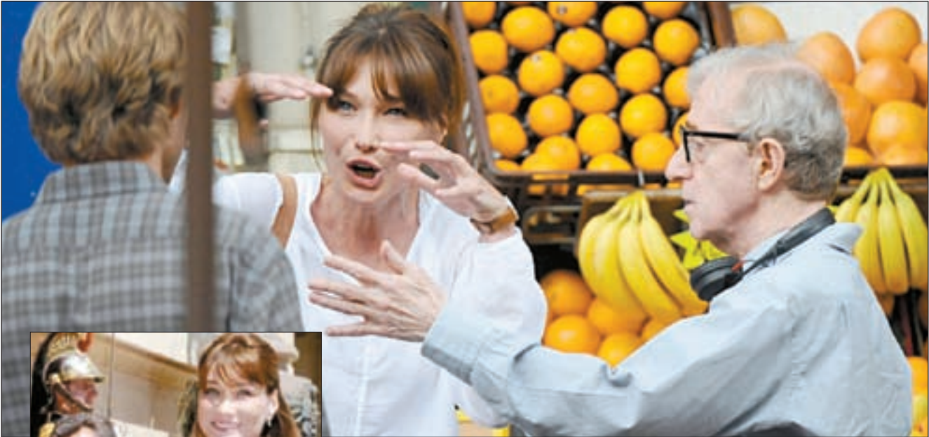
كارلا أثناء التصوير وفي الإطار مع ساركوزي

باريس - وكالات: يبدو أن الرئيس الفرنسي نيكولا ساركوزي لم يتحمل غياب زوجته كارلا بروني ساركوزي عنه بسبب انشغالها في تصوير دورها في أحد الأفلام السينمائية، فقرر أن يفاجئها في زيارة خاطفة له في موقع تصوير الفيلم. فقد ذكرت صحيفة فرنسية أن نيكولا ساركوزي وضع أمور الدولة جانبا ليقوم بزيارة زوجته في موقع تصوير فيلمها الجديد «منتصف الليل في باريس»، الذي يتولى إخراجها المخرج الأمريكي المخضرم وودي آلان. وظهر ساركوزي في موقع تصوير الفيلم لرؤية زوجته كارلا التي تلعب أحد أدوار البطولة في الفيلم، في أول مشاركة سينمائية لها. وقد بقي ساركوزي ساعتين في موقع التصوير وقدم التحية للمخرج وودي آلان، قبل أن ينصرف هو وزوجته كارلا لمنزلهما.