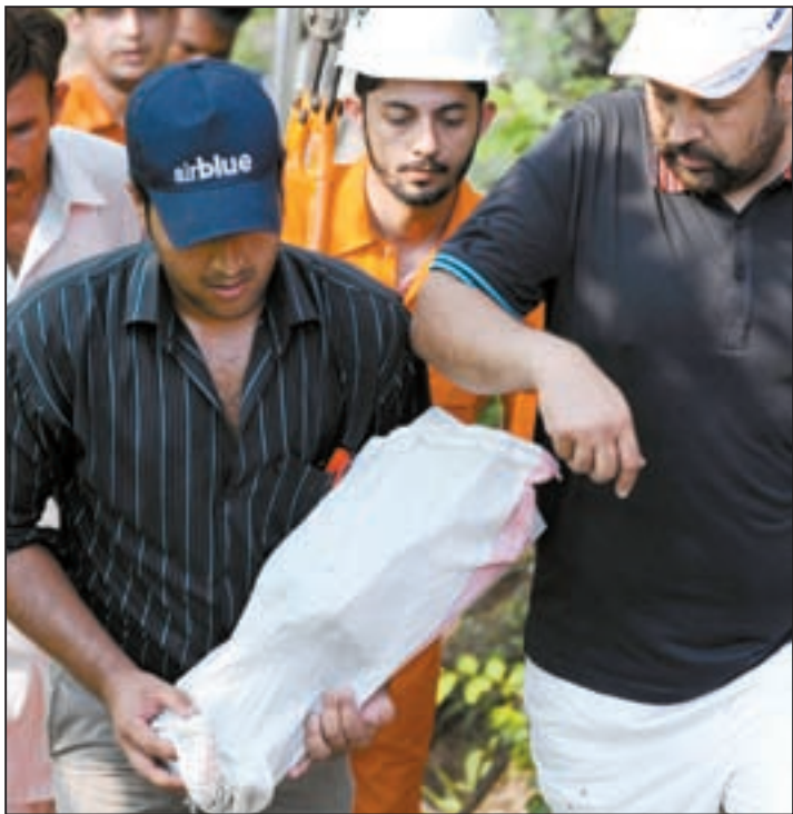
أحد المسؤولين الباكستانيين يحمل الصندوق الأسود

بيشاور - باكستان - أ.ف.ب: أفادت السلطات المحلية أن المسعفين والجنود يبذلون كل ما في وسعهم السبت للوصول إلى آلاف الأشخاص المتضررين من الفيضانات في شمال غرب باكستان وهي الأسوأ التي تشهدها البلاد وأسفرت عن ما يقارب من 3 آلاف قتيل على الأقل.