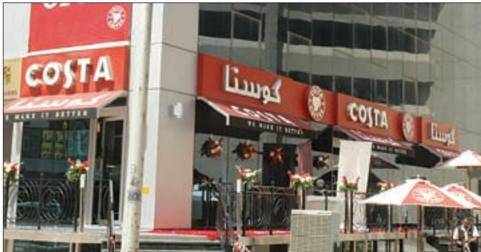
فرع «كوستا كافيه» الجديد في مجمع الصقران التجاري