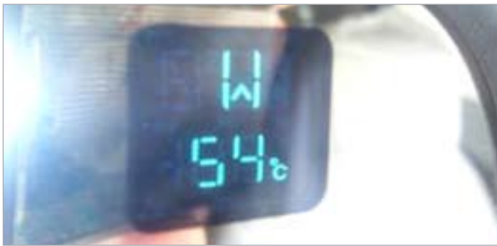
مؤشر السيارة سجل 54 درجة مئوية

سجلت ادارة الأرصاد الجوية درجات حرارة زادت على 50 درجة مئوية في مدينة الكويت وأكثر من 53 درجة مئوية في منطقة صحراوية شمال غرب البلاد تسمى (مطربة) وذلك في تمام الساعة الثانية عشرة والنصف ظهر اليوم. وبحسب الموقع الالكتروني للإدارة التابعة للادارة العامة للطيران المدني فإن المناطق الصحراوية سجلت درجات حرارة مرتفعة جدا فاقت 50 درجة مئوية في بعض المواقع والمدن كالجھراء والعبدلي والوفرة مع نسب رطوبة متدنية.