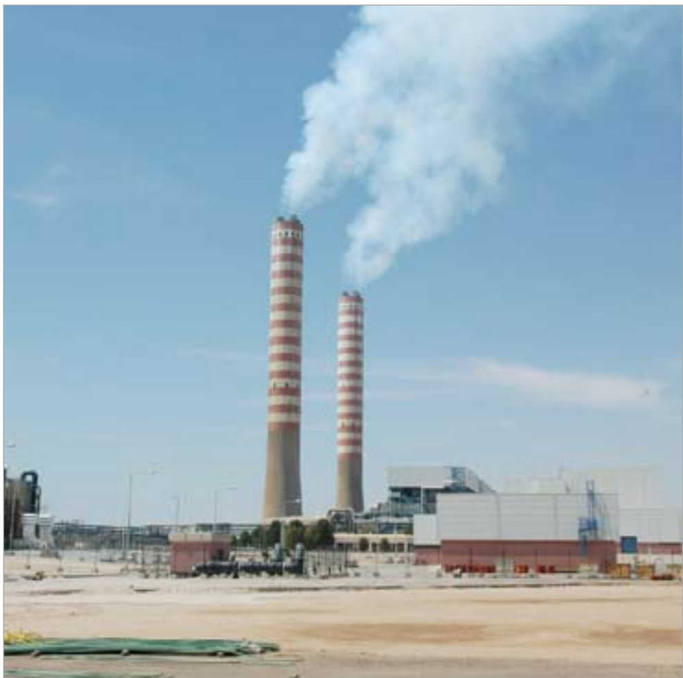
الوزارة لجأت إلى تحويل وحدات المقطرات المائية في محطة الصبية لتوليد الكهرباء

قال وزير الكهرباء والماء د.بدر الشريهان انه تم التنسيق مع كل المؤسسات الحكومية لإطفاء أجهزة التكييف والأجهزة الكهربائية غير الضرورية فور انتهاء الدوام الرسمي فيها. وثمن الشريهان في تصريح صحافي مبادرة النائب الأول لرئيس مجلس الوزراء ووزير الدفاع الشيخ جابر المبارك بتشغيل