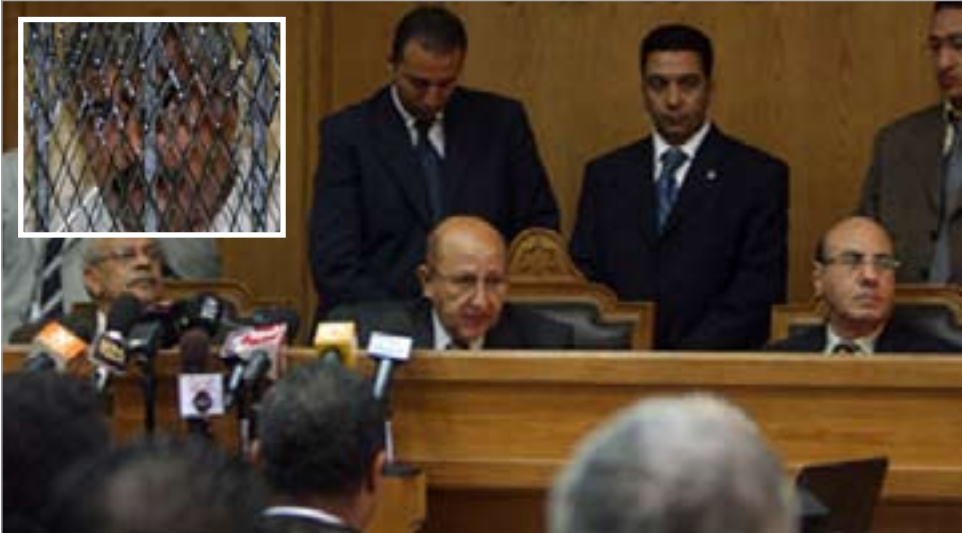
المستشار عادل جمعة أثناء الجلسة.. وفي الإطار هشام طلعت

إجمالي الصور يعادل 750 مليون صورة، وفي الوقت الذي تقدر فيه قيمة استخراج الصورة الواحدة بجنيه واحد تكون القيمة الإجمالية لرسم استخراج الصور 750 مليون جنيه.