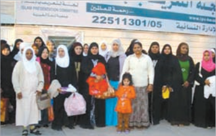
المشاركات في الرحلة

استضاف رئيس قناة «اقرأ» الفضائية د.جاسم المطوع وفد الملتقى الأوروبي – الكويتي بمرعته بمنطقة الوفرة، معربا عن سعادته بأقوال المهنيين بانهم شاهدوا في الكويت العديد من المؤسسات الدينية التي توضح صورة الإسلام الحقيقية، تخلل الجولة ورشة عمل شروح فيها المطوع خلالها بعض آيات الخالق جل وعلا في الكون.