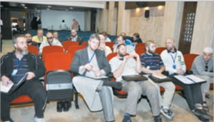
المشاركون في الرحلة

وحول المسؤولية الملقاة على عاتق الدعاة اكد د.المشعان ان ضعف الوازع الديني سببه العواظ الذين لا يستطيعون توصيل الرسالة الدينية الى عقول الشباب بطرق مرغوبة ومحبية، ويجب على رجال الدين ان يركزوا على الترويج قبل الترهيب والايات القرآنية عندما نزلت جاءت بطريقة تدريجية، وان المشكلة ان بعض رجال الدين غير مؤهلين وغير متخصصين في دراسة الفقه، ونحن نتساءل لماذا يقبل الشباب اليوم على الداعية عمرو خالد؟ فانا ارى انه استطاع ان يوصل الرسالة الدينية الى الشباب بطريقة محببة الى النفس ونجاح الداعية عمرو خالد اتى لانه يعرف جيدا