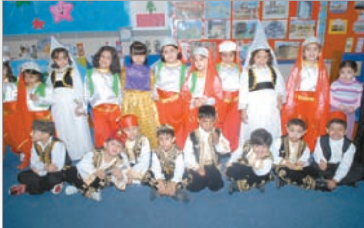
أطفال الروضة يرتدون أزياء البلدان المختلفة

قام مركز الاستقامة للعلوم الشرعية والعلاج من الإدمان التابع لإدارة الدراسات الإسلامية بوزارة الأوقاف والشؤون الإسلامية بتنظيم رحلة الى مخيم الوزارة، حيث ضمت الرحلة عددا كبيرا من أبناء المركز وعائلاتهم واشتملت الرحلة على أنشطة ثقافية ورياضية ولعاب في كرة الطائرة وبيبي فوت وتنس الطاولة.