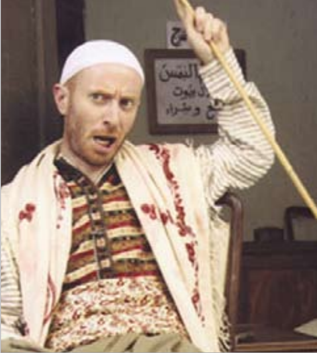
هل يتفوق «النمس» على جمال سليمان أجرا الموسم المقبل

أوصى المؤتمر الوطني للطاقة الذي اقيم في دمشق أخيراً، باستثمار الموقع الاستراتيجي لسورية لنقل وعبور مصادر الطاقة الهيدروكربونية والكهربائية والمتجددة من خلال الربط الطاقى مع الدول العربية والإقليمية الصديقة وإعادة هيكلة الإطار التنظيمي وحوكمة قطاع السطاقة من خلال تطبيق مبدأ الاستقلالية الاقتصادية والوصول إلى حالة التوازن في أسعار حوامل الطاقة. ودعا المشاركون إلى ترشيد استهلاك الطاقة وتحسين كفاءتها في جميع المجالات وتقليص الهدر الطاقى ونشر الوعي المجتمعي لدعم ذلك وتعزيز البرامج الخاصة للحد من التزايد السكانى من أجل الحفاظ على الموارد المتاحة وتخفيض المصروف الطاقى إلى حده الأدنى في شركات إنتاج النفط وصناعته وتوزيعه وشركات توليد الكهرباء.