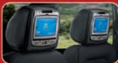
نظام الءرءءه باءراس DVD مع سماءئ رأسئ (إءءارئ)