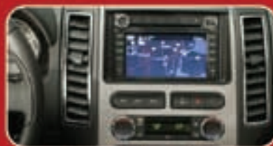
نظام الءلاءمة GPS (إءءارئ)

ءءضلوا بزارئة إءءئ معارض المءموءة فئ الشوءء والأءمءئ للإسءماء ءءءربة ءئاءة فورء إءء.