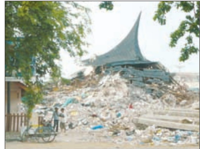
منازل مساءقءء من ءراء الزلازل