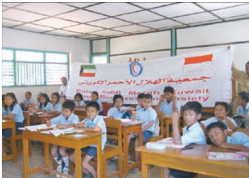
إنشاء مءرسة للأءام فئ قرئة الشئء ءابر الاءمء