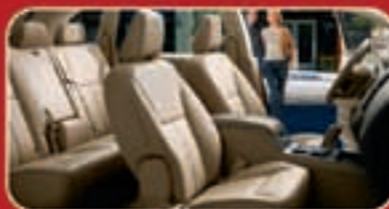
مءاءء ءءءئة أئئة مع نظام الءاءرة (لءءء السائل)