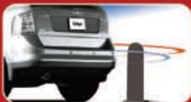
نظام اسءءمار عءء الرءوء للءءء