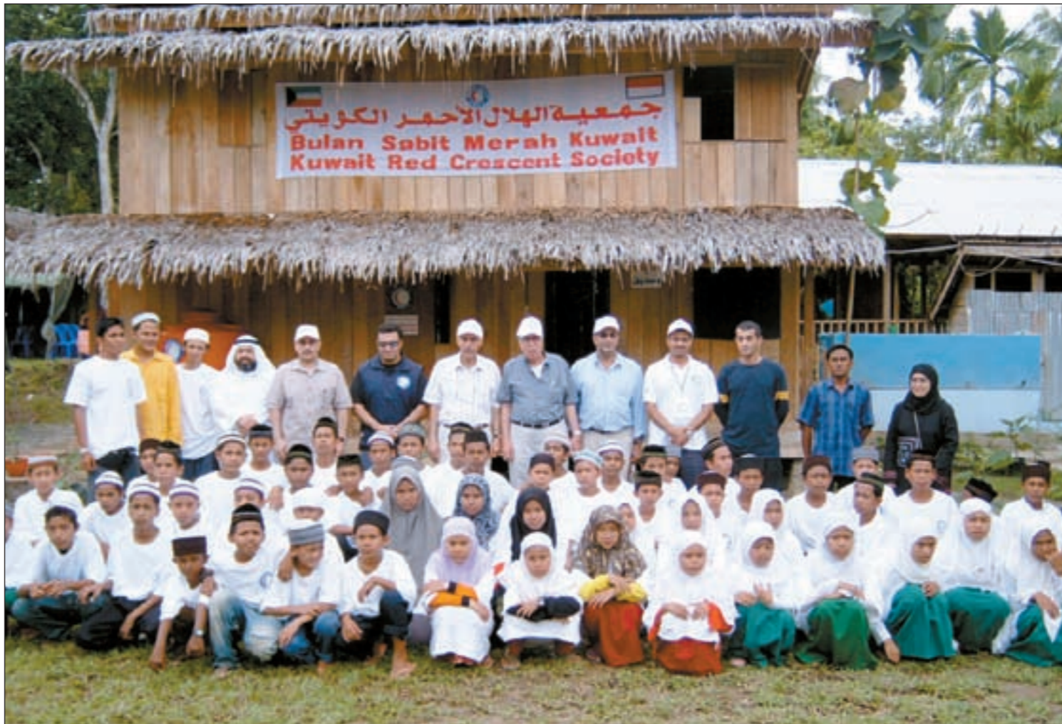
رئئس الهلل الأحمر الكوئئ وءءء من أركآن سفارءنا فئ إنءونئسئا ءئوسطن الأءام