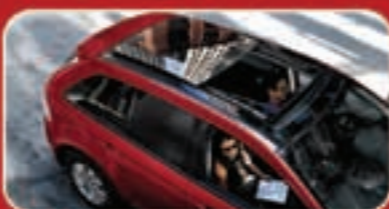
ءءمة سءء باءوراءمة - فئسا روء (إءءارئ)