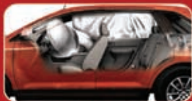
نظام سئفئ ءائوس للسلامة