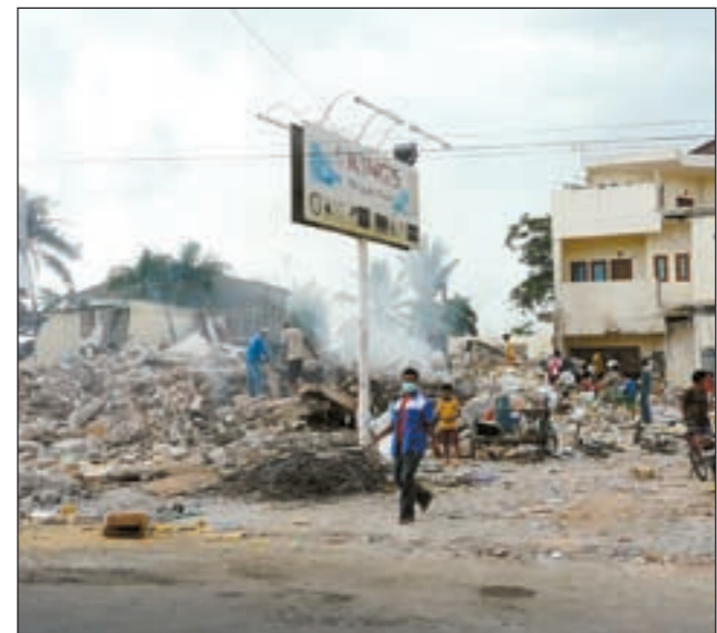
ءانب من الءمار الءئ ءعرضء له مءافاة باءق