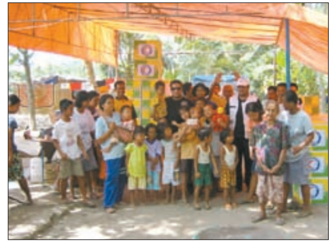
ءوزئع المعوناء على المءءاءئن