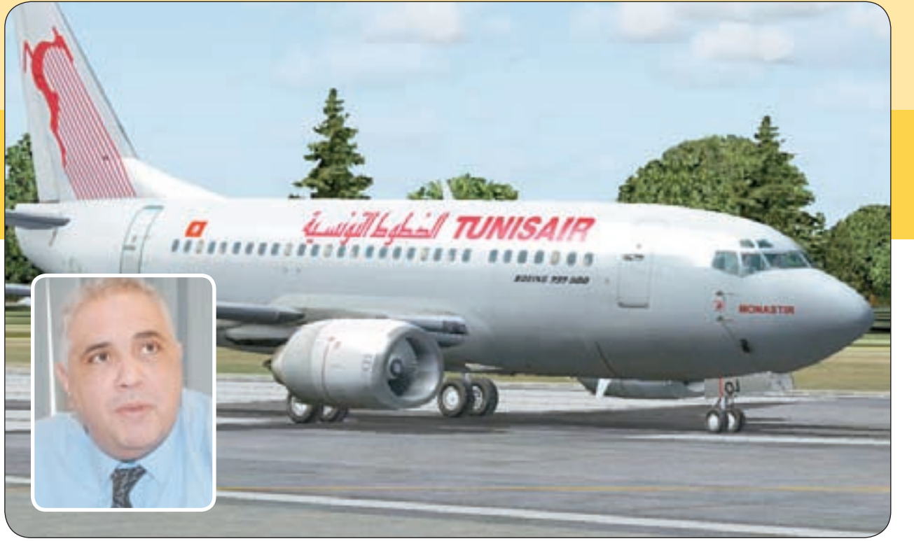
الطائرة التونسية ويبدو في الاطار كريم قديشش