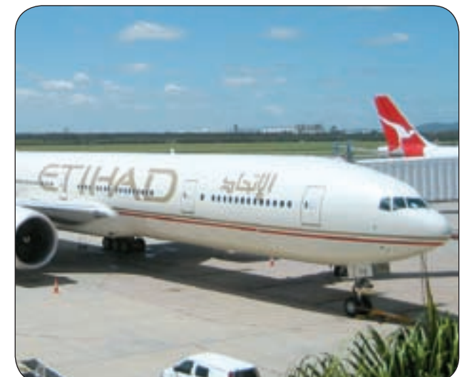
طائرة الاتحاد في مطار سيدني الأسترالي