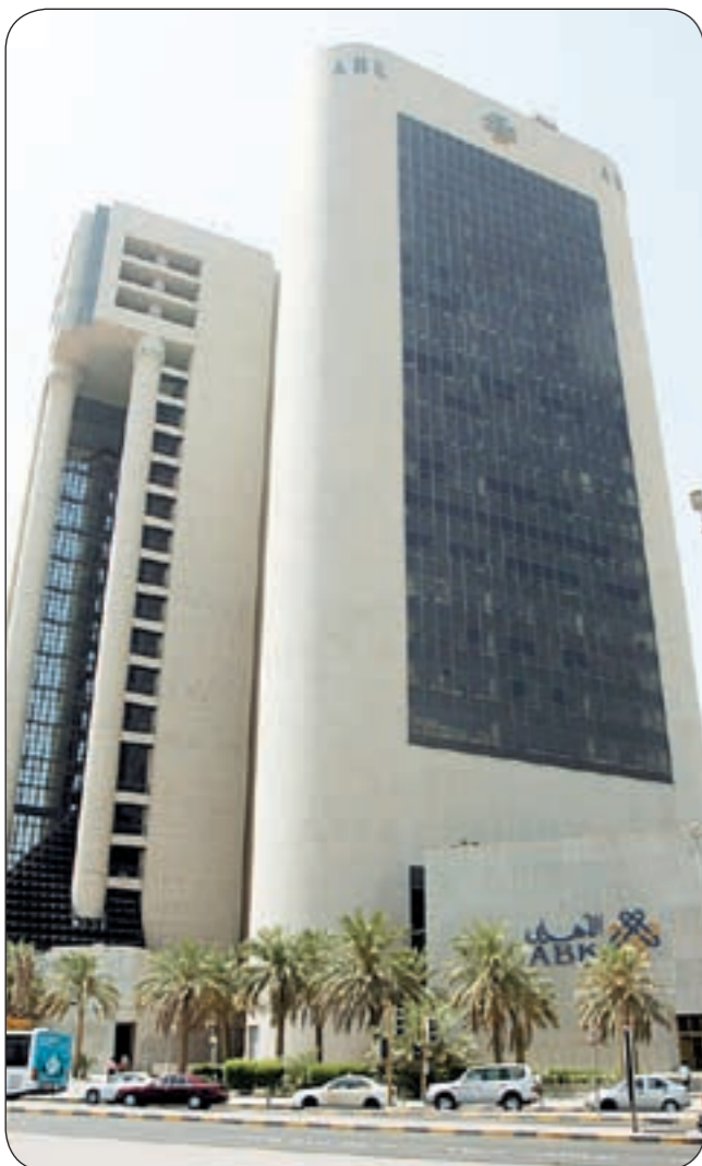
العائد على أصول البنك الأهلي بلغت نسبته 1,54٪

في ظل هذه الأوضاع الصعبة تدل على استقرار وضع البنك وقدرته على النمو وتحقيق الأرباح، خاصة في قطاع الأنشطة التشغيلية الأساسية وهي نتيجة طبيعية للإستراتيجيات السليمة التي يطبقها البنك والتركيز على الاستثمارات في البنية التحتية والتوسع في المنتجات والخدمات وزيادة شبكة الفروع مع تنوع مصادر الدخل، كما أن إجراءات المراقبة الفعالة للتكلفة وخفض المصروفات ساهمت في تحقيق هذه النتائج الممتازة. وأضاف قائلاً: «يسعى البنك الأهلي دائماً لتقديم خدمات مصرفية من الطراز الأول لكافة عملائه وتطوير خدماته المصرفية باستخدام أحدث الأساليب التكنولوجية المتوافرة في