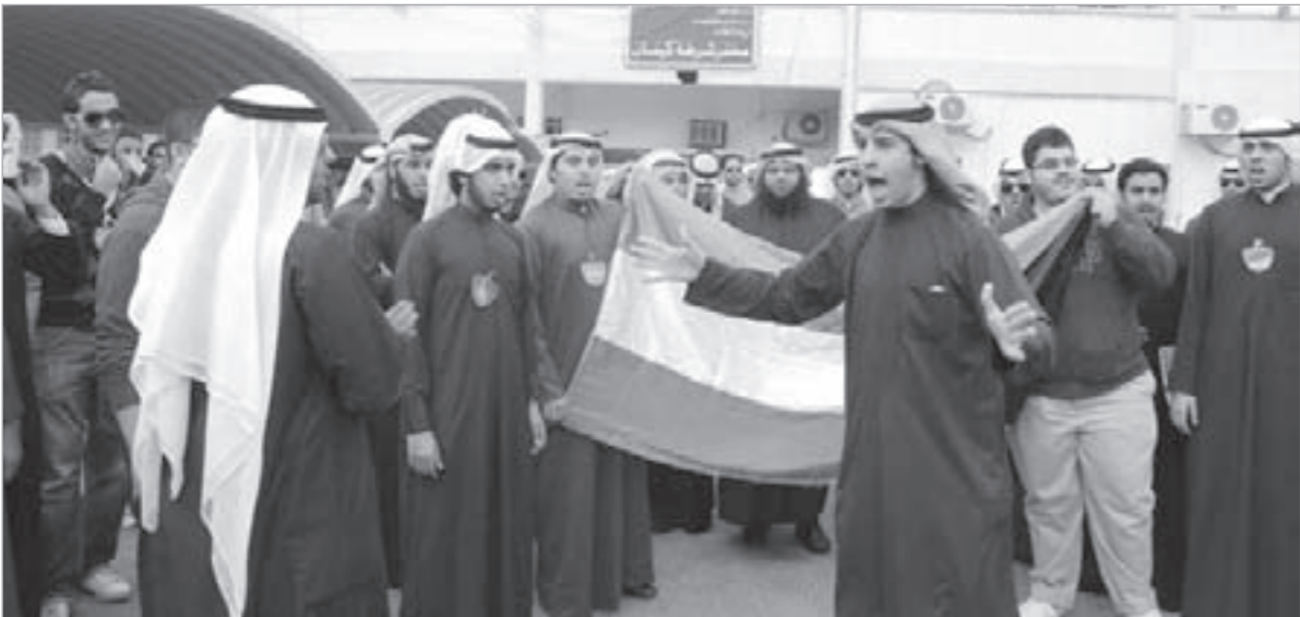
جانب من الاعتصام الذي نظمته القائمة الائتلافية أمام مخفر كيفان