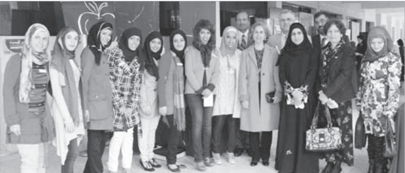
الشريحة حصة الصباح تتوسط عضوات الفريق