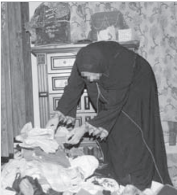
المواطنة في شقتها بعد مصادمة المباحث