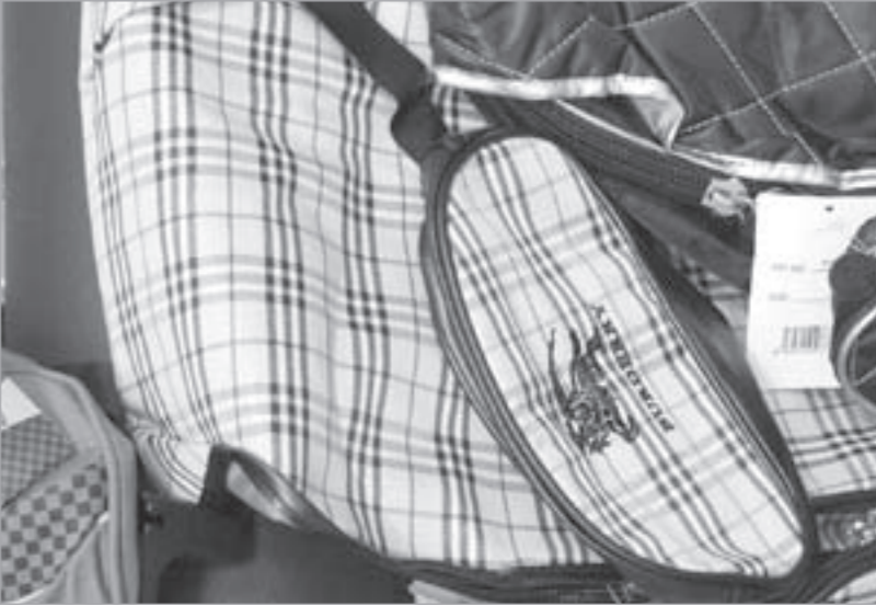
«التجارة» مطالبة بملاحقة المقلدات في السوق المحلي