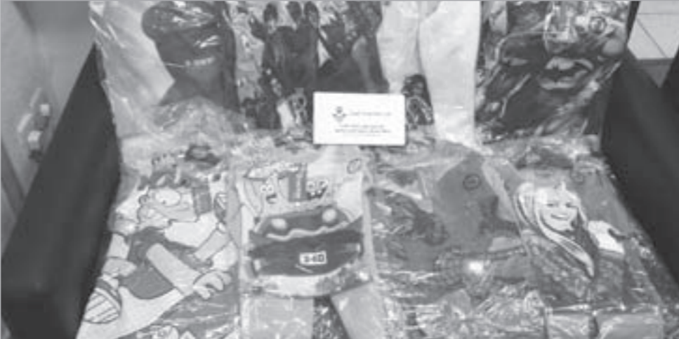
جانب من مضبوطات الجمارك

وقال للأسف الشديد هناك شركات في دول شرق آسيا متخصصة في تقليد المنتجات الأوروبية والماركات العالمية مشيرا الى انه من المقبول الى حد ما ان تقوم شركة بوضع اسم مشابه