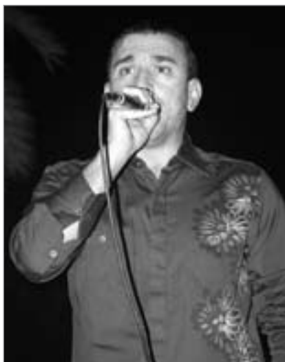
الفنان محمد عدوية

في إطار البرامج والأنشطة التي نظمتها شركة المشروعات السياحية للاحتفال بمظاهر عيد الفطر السعيد نظمت الشواطئ والأندية البحرية برامج ترفيهية وترويحية احتفالاً بهذه المناسبة السعيدة وما تحمل من معانٍ، من جهة قال علي شهاب القلاف مدير إدارة الشواطئ والأندية البحرية إن إدارة الأندية والشواطئ أعدت البرامج التي شاركت فيها الشخصيات الكرتونية والأطفال من الأولاد والبنات وإن إدارة الأندية تحرص دائماً على تنظيم البرامج والأنشطة في المناسبات المختلفة الدينية والوطنية والشعبية والاجتماعية لأعضاء الأندية البحرية وأسرهـم وايضاً لزوار الشواطئ البحرية