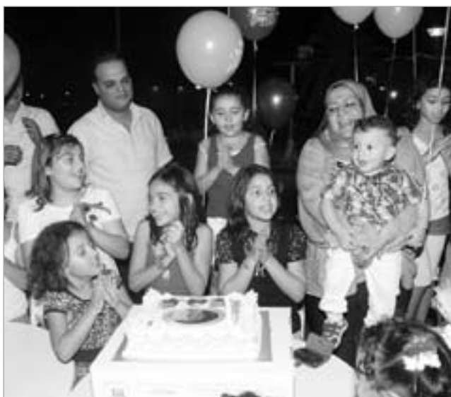
أسرة من أعضاء نادي الشعب تحتفل بعيد ميلاد أحد أبنائها