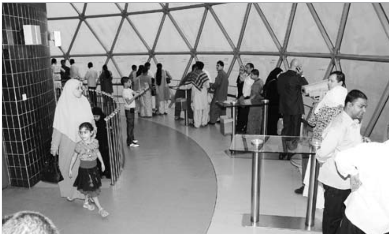
جانب من زوار الكرة الكاشفة

تتضمن وجبة مجانية خفيفة لزوار الكرة الكاشفة