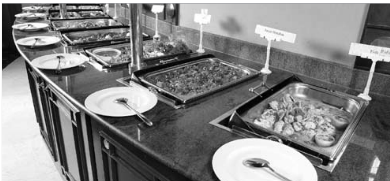
جانب من البوفيه الرئيسي المتنوع في الأبراج