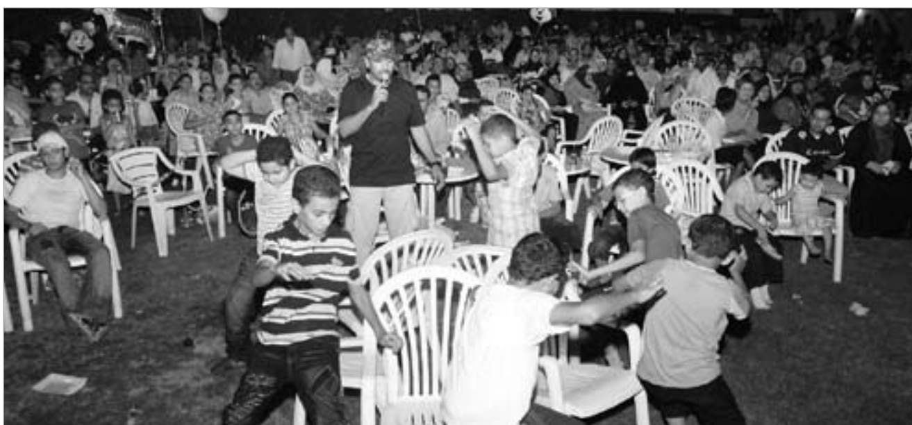
فترة فنية للصغار