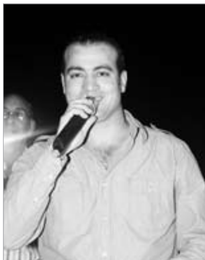
الفنان ناصر السليوي