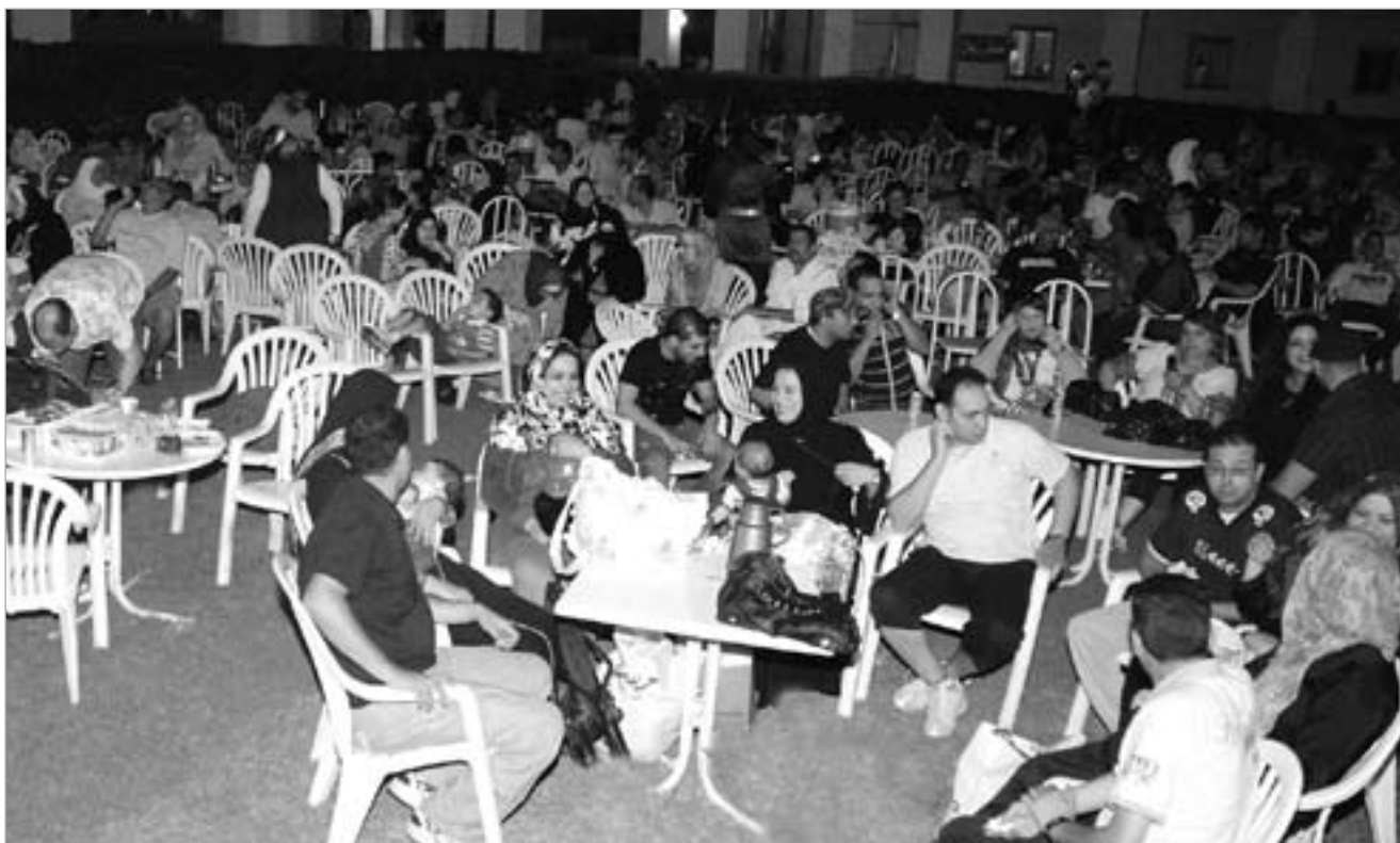
حضور كثيف في شاطئ المسيلة

برامج وأنشطة ترفيهية وترويحية طوال أيام عيد الفطر المبارك