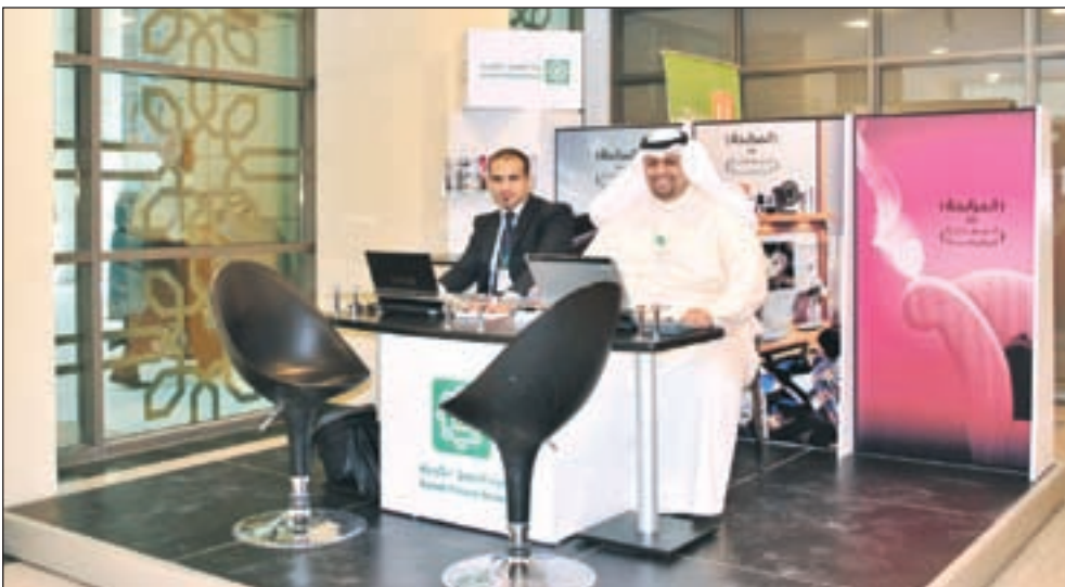
جانب من جناح «بيتك» في بيت الزكاة

وقال أبو دقة: «الجانب الإسرائيلي يماطل وكعادته لم يوف بالاتفاق، الجانب الإسرائيلي يتحمل الخسارة