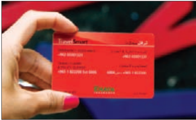
بطاقة الخليج للتأمين المتكامل

شخصية للتأمين بعد ذلك. وأشار البنك إلى أن برنامج التأمين مضمون من لوبدين في لندن ومقبول في جميع السفارات الأجنبية ويوفر التأمين الشامل في دول مثل الولايات المتحدة وأستراليا. ويؤمن البرنامج العملاء حتى سن 75 عاماً دون أي مصاريف إضافية.