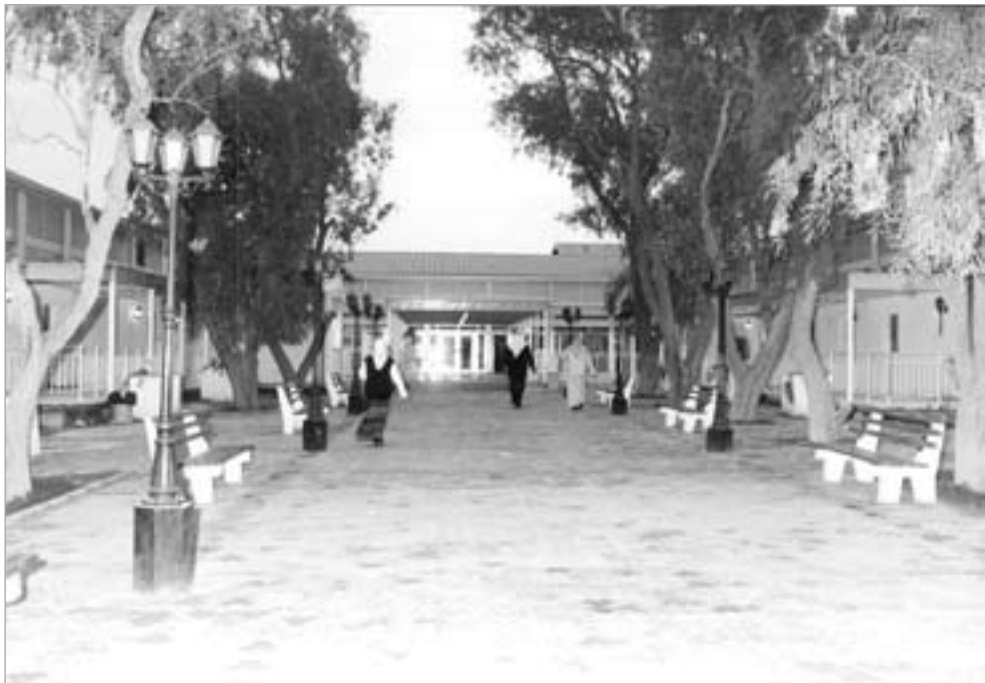
مستشفى شركة نفط الكويت يحتاج إلى إعادة إنشاء من جديد