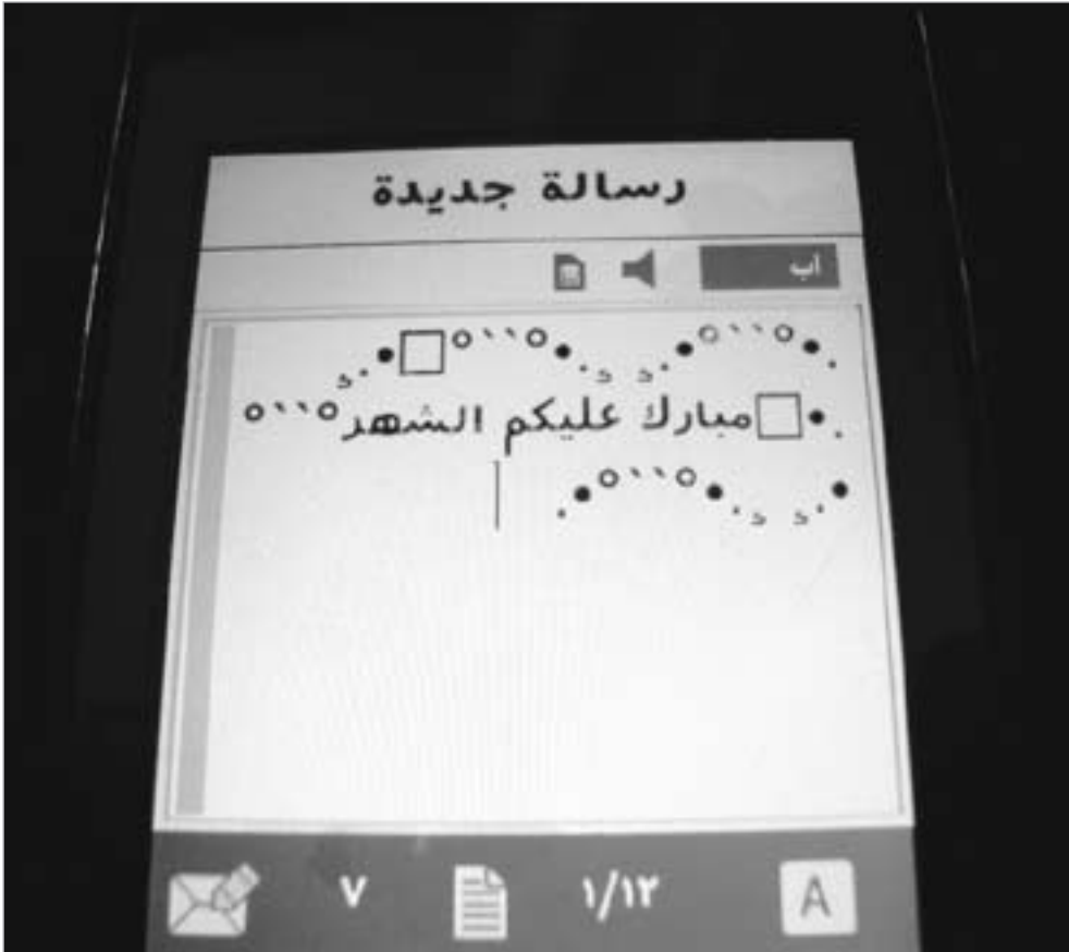
مبارك عليكم الشهر