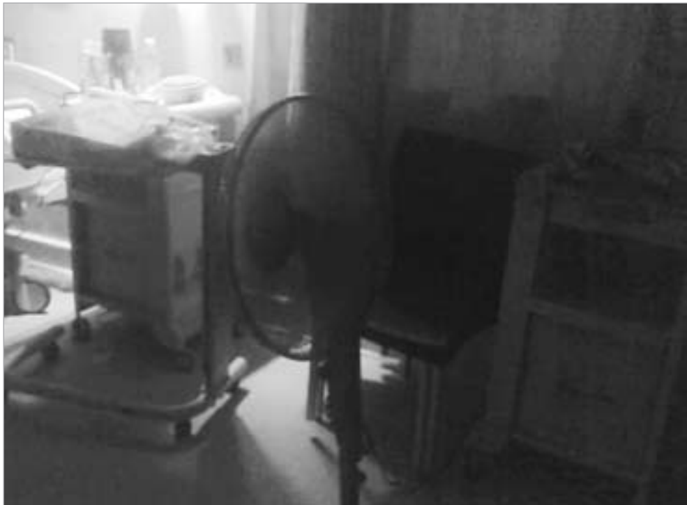
بعض الأهالي جلبوا مراوح لتخفيف الأوضاع

◀ الطاحوس: ما يحدث كارثة ومأساة إنسانية فالتاس تأتي للعلاج فتفاجأ بأن خدمات المستشفى ضعيفة والمبنى مضى على إنشائه أكثر من 60 عاماً