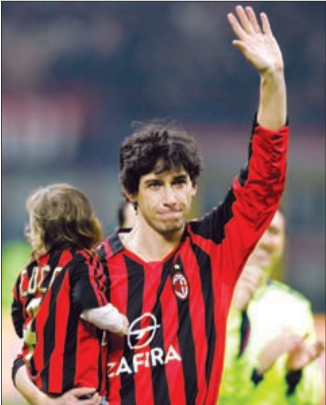
الإيطالي ديميتريو ألبيرتيني أسوأ الصفقات