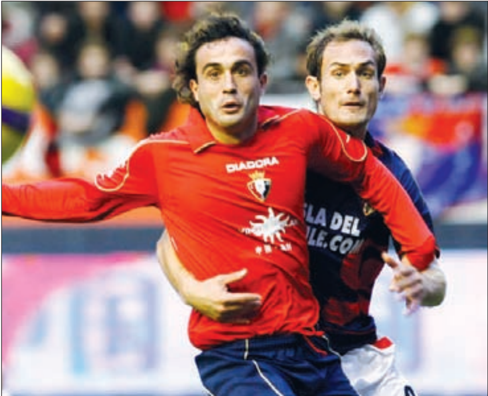
الإسباني سانتياغو إيزكويرو كان حبيس مقاعد الاحتياطيين