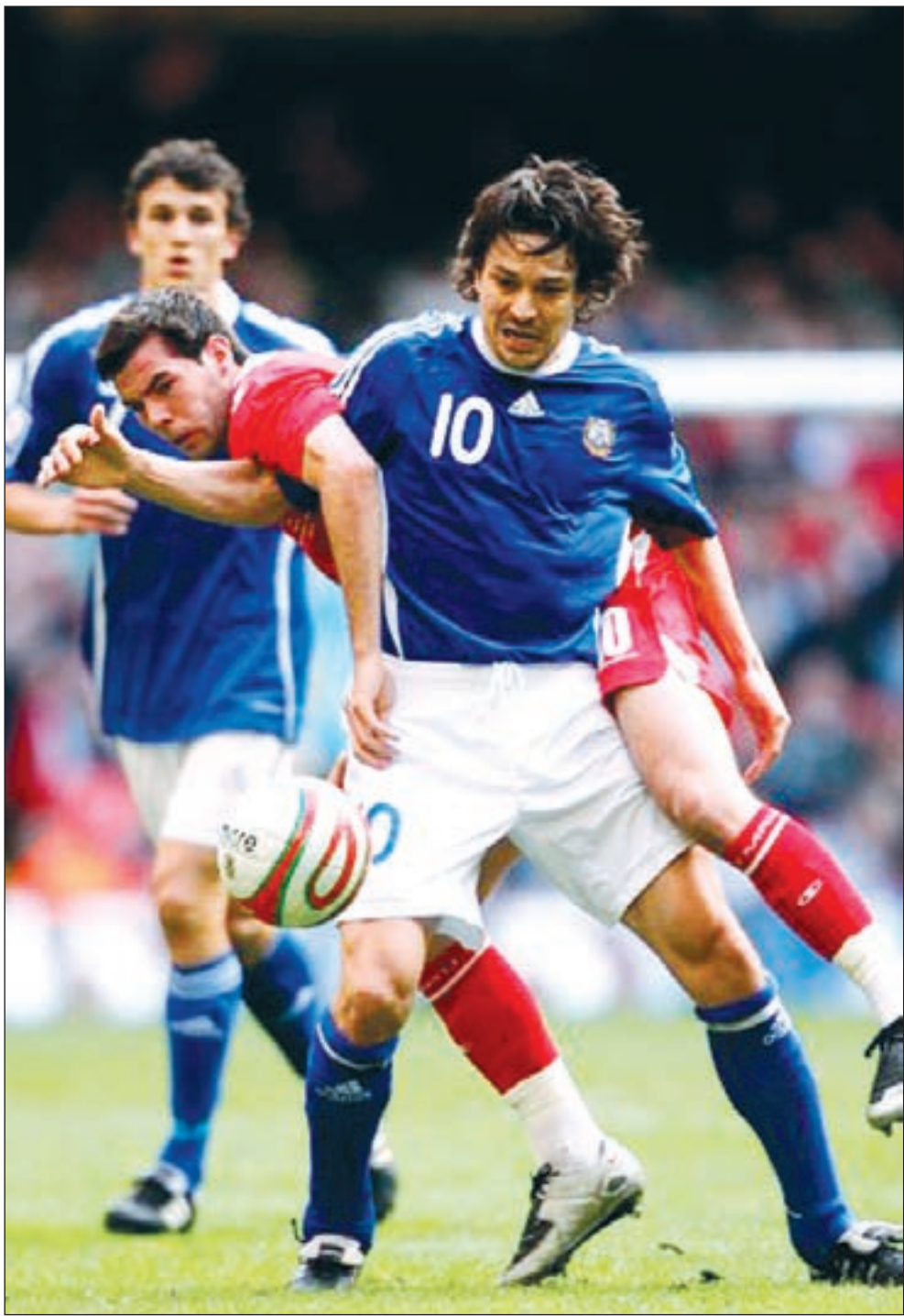
الفنلندي ياري ليتمان سرعان ما رحل عن برشلونة

الدوري سادسا، وانتهى المطاف ببونانو في دوري الدرجة الثانية الإسبانية رفقة ديبورتيفو ألافيس.