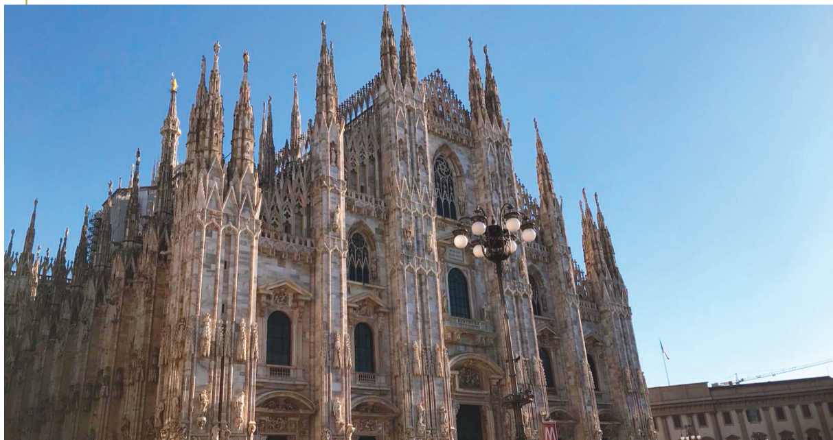
كاتدرائية الدومو أشهر معالم مدينة ميلانو