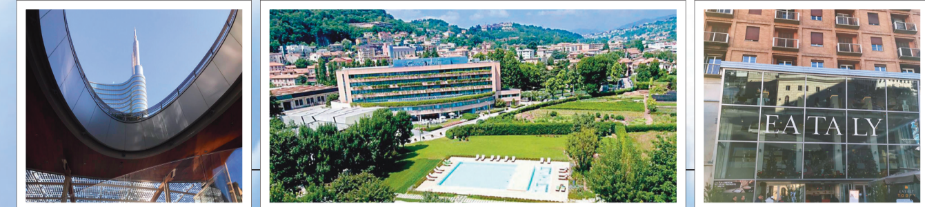
مجمع EATALY لؤلؤ صحي في ميلانو