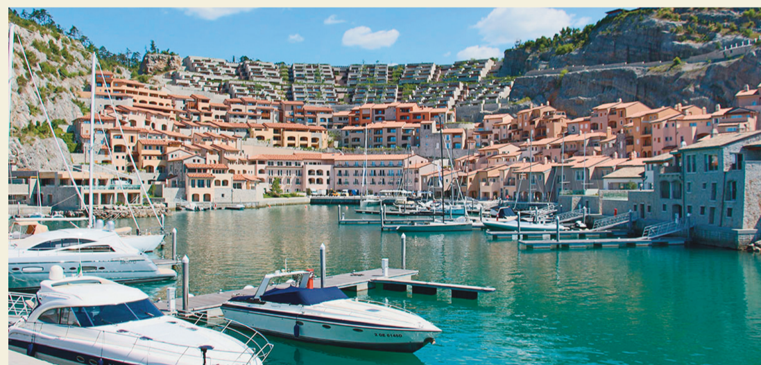
إطلالة مميزة على البحر الأدرياتيكي

شعاعر الفندق هو ما قاله عنه الشاعر الرومانسي راينر ماريا ريلكه أثناء إقامته: «الإقامة هنا أعجوبة» ليخص تجربته الرومانسية على الشاطئ الأدرياتيكي ذي الرمال البيضاء المحيطة بالمنتجع. به 65 غرفة وجحاجا، وجميعها له إطلالة بحرية على هذا الشاطئ الأعجوبة. وعلى بعد خطوات بقع منتجع «بورتو بيكولو» الصحي الذي يمنح الضيوف تجربة رومانسية تتفاعل مع الطبيعة الرائعة التي تحيط بالفندق، لتمنح الضيوف خدمات وعلاجات طبية مفيدة.