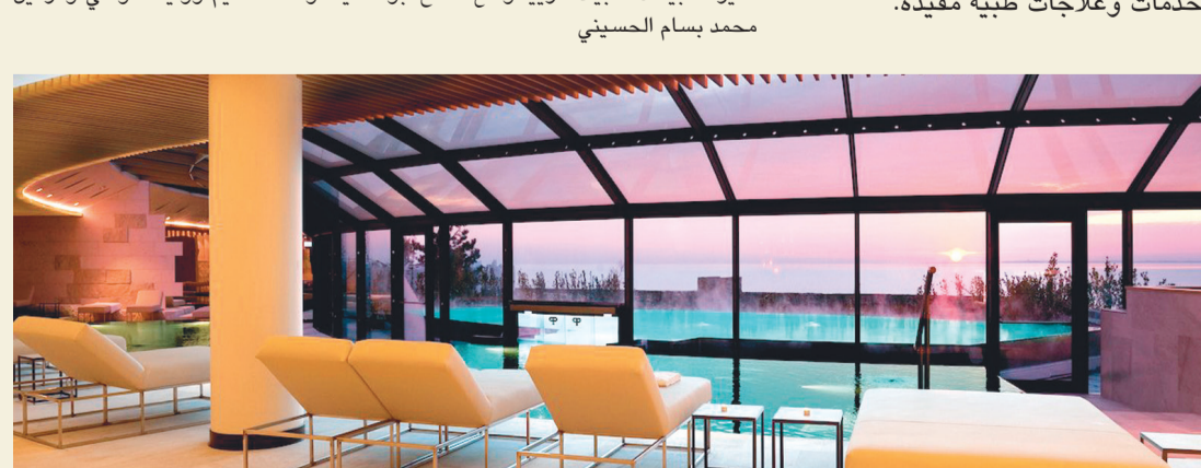
المنتجع يشتهر بأحد أشهر الأندية الصحية في العالم

شعاعر الفندق هو ما قاله عنه الشاعر الرومانسي راينر ماريا ريلكه أثناء إقامته: «الإقامة هنا أعجوبة» ليخص تجربته الرومانسية على الشاطئ الأدرياتيكي ذي الرمال البيضاء المحيطة بالمنتجع. به 65 غرفة وجحاجا، وجميعها له إطلالة بحرية على هذا الشاطئ الأعجوبة. وعلى بعد خطوات بقع منتجع «بورتو بيكولو» الصحي الذي يمنح الضيوف تجربة رومانسية تتفاعل مع الطبيعة الرائعة التي تحيط بالفندق، لتمنح الضيوف خدمات وعلاجات طبية مفيدة.