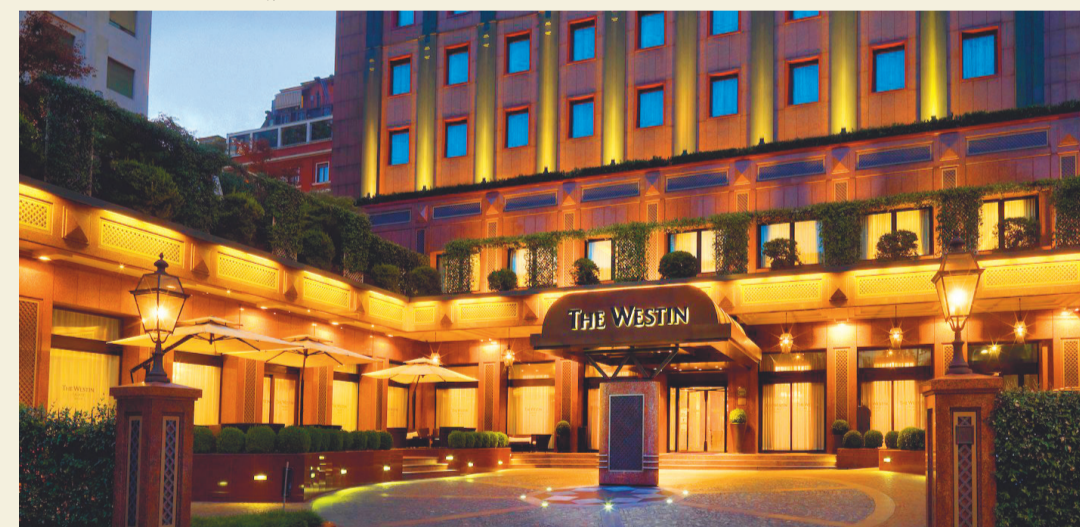
فندق وستن بالاس ميلانو في موقع مميز قرب الاماكن السياحية الرئيسية في المدينة

مصمم وفق معمار عصر النهضة الإيطالي كأحد القصور التيوكلاسيكية لأمرأة النهضة الأوروبية. على 12 طابقاً و231 غرفة. وتميزه واجهته المصنوعة من الرخام الأحمر، وبالفندق بلكونة واسعة جدا على سطحها بها إطلالة رائعة كامل مدينة ميلانو. وتم تصميم غرف الفندق من الداخل بجدان من ألوان الباستيل مع تحف إيطالية ثمينة.