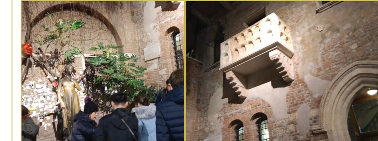
منزل جوليت حبيبة روميو وتمثالها في مدينة فيرونا