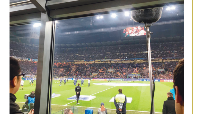
من مباراة «انترميلان» و«بيندهوفن»