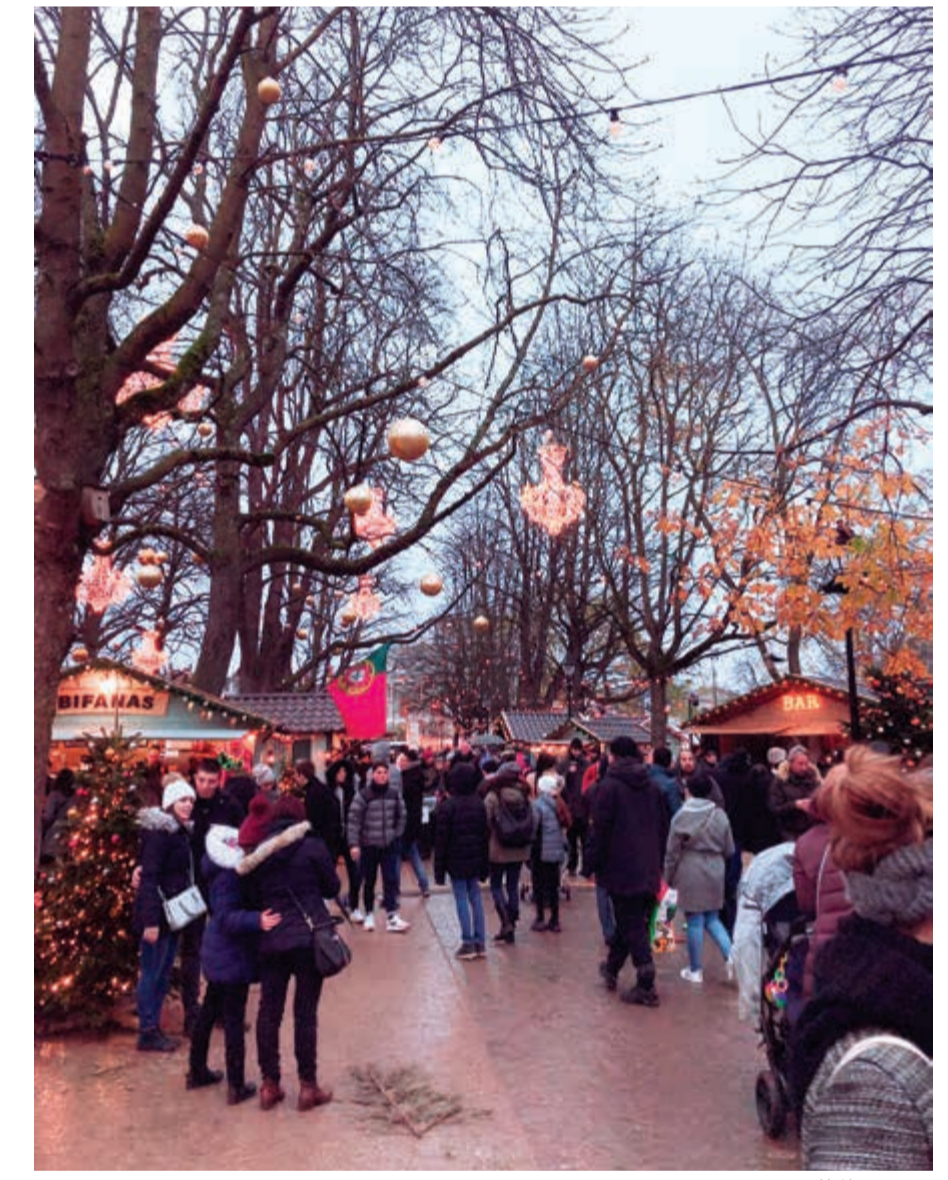
سوق عيد الميلاد

تقع جنيف جنوبيا على ضفاف بحيرة ليمان في موقع إستراتيجي بين فرنسا وسويسرا، ويتدفق إليها السائح على مدار العام، لكن لزيارتها في شهر ديسمبر رونقا خاصا، فليل عرّوض رأس السنة ومهرجان الألعاب النارية مقام «سوق الكريسماس» الخاص بكل لوازم عيد الميلاد، وفي تاريخ 12-ديسمبر من كل عام تحيي المدينة تذكرا لانتصارها على فرنسا بما يسمى بعيد السلام ورمزه الأبريز فطناجر أو قدور الشوكولاتة، ويعود إلى 11 ديسمبر في العام 1602م، ففي ذلك التاريخ هاجم الفرنسيون