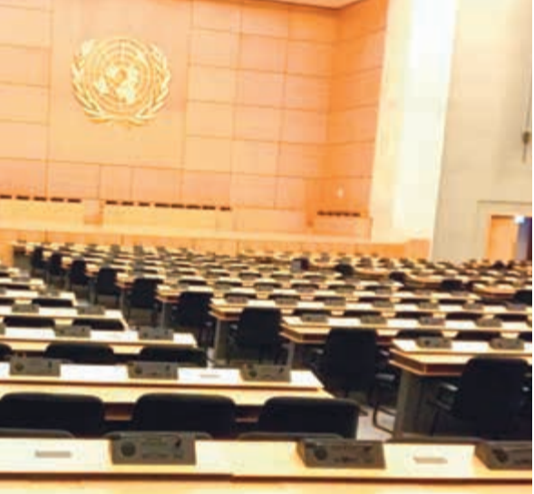
أكبر مقر للأمم المتحدة في أوروبا