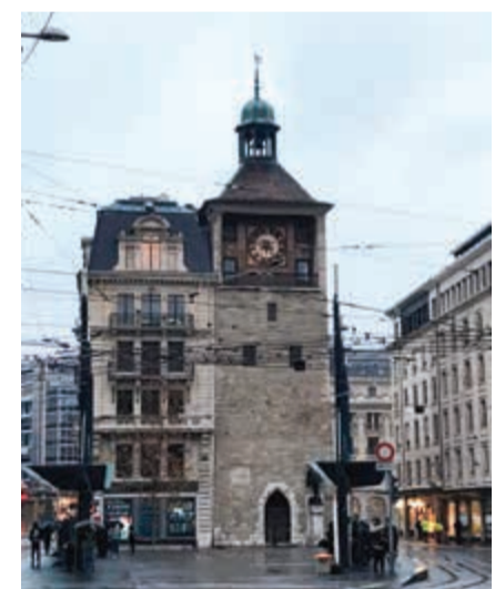
مدخل المدينة القديمة

بخلاف أغلب المدن الأوروبية الكبرى لا تعاني جنيف في أغلب ساعات النهار والليل من أي زحمة سير خائفة، ويسهل فيها التنقل سواء بالسليارة