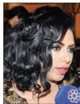
الشيخة بشاير نايف الصباح

حققت الكويت المركز الثاني في موسوعة غينيس للأرقام القياسية كأكبر تجمع للأهيات عبر تشكيل سلسلة بشرية كإهداء من أهيات الكويت لأهيات العالم، وذلك في الاحتفالية التي نظمتها شركة فيستا كويت مساء أمس الأول في مجمع 360 تحت رعاية رئيسة الجمعية الكويتية للأسرة المثالية الشبيخة فريحة الأحمد، ووسط حضور عدد من