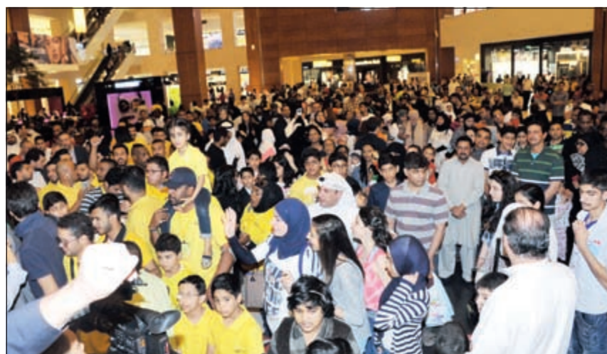
جموع من المشاركين في الاحتفالية

أهيات الكويت والعالم في تلك المناسبة العزيرة. بدوره، أشاد القاضي بموسوعة غينيس للأرقام القياسية غلين بولند بالتنظيم الكويتي لهذه الاحتفالية، مشيرا إلى أن الكويت نجحت في محاولتها إلى الوصول للمركز الثاني بتجمع بشري وصل عدده إلى 459 فردا، لتأتي بعد جمهورية الصين الحاصلة على المركز الأول بـ586 فردا، لافتا إلى أن الموسوعة حريصة كل الحرص على تطبيق كل