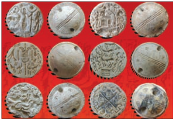
الاختام الدولوية في فيلكا