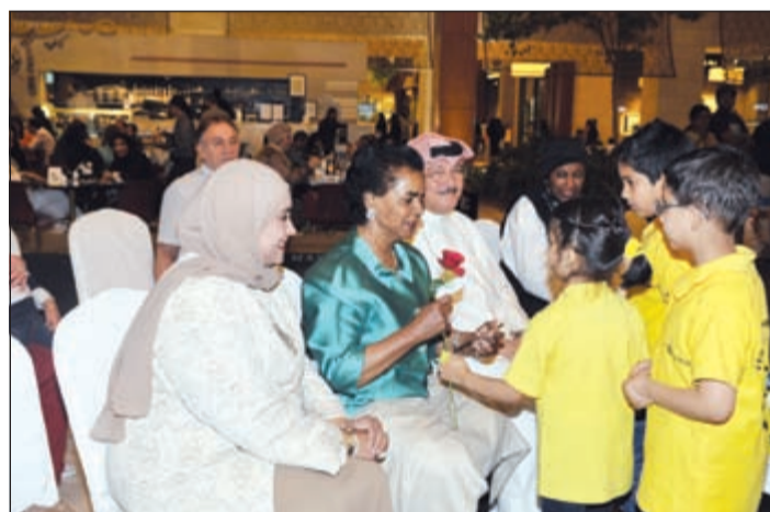
مجموعة من الأطفال يقدمون للشيخة فريحة الأحمد