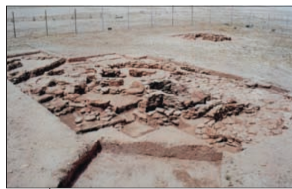
مستوطنة جزيرة طيبج تمثل بداية الاستيطان على أرض الكويت أرخت 6000 سنة من الوقت الحاضر

أما في جزيرة (فيلكا) فقد عملت البعثة الكويتية الدنماركية في موقع (تل سعيد) والذي يطلق عليه المدينة (الدلوية) وهي مؤرخة بـ4000 عام من الوقت الحاضر، وكان التركيز