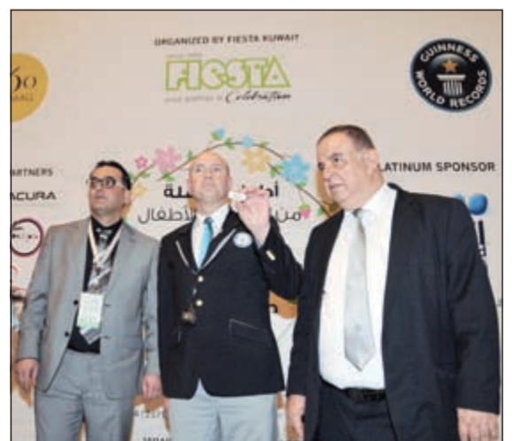
قاضي موسوعة غينيس للأرقام القياسية غلين بولند يعلن النتيجة