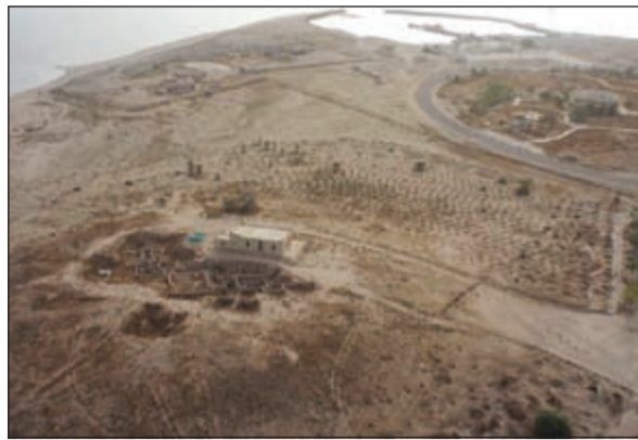
المدينة الدولوية في فيلكا