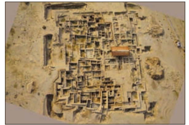
القلعة الهلنستية في فيلكا

بدعم كبير من المجلس الوطني للثقافة والفنون والآداب