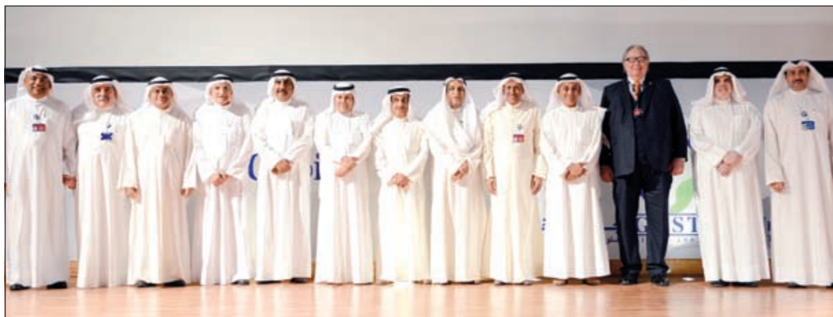
أعضاء مجلس أمناء «Gust» السابقون والحاليون خلال حفل التكريم